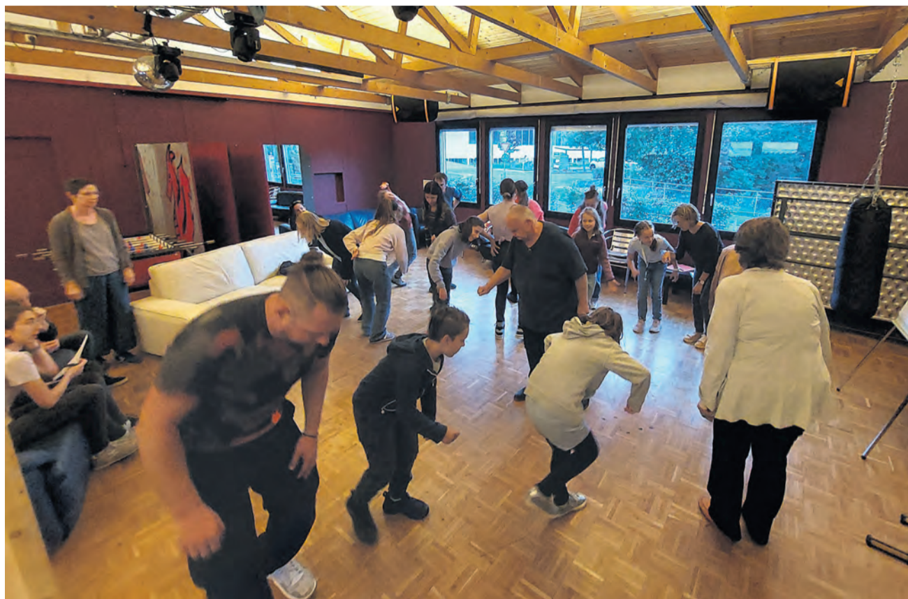
Grosses Engagement der Jüngeren und der Älteren bei den ersten Improvisationsübungen im Jugendtreff.